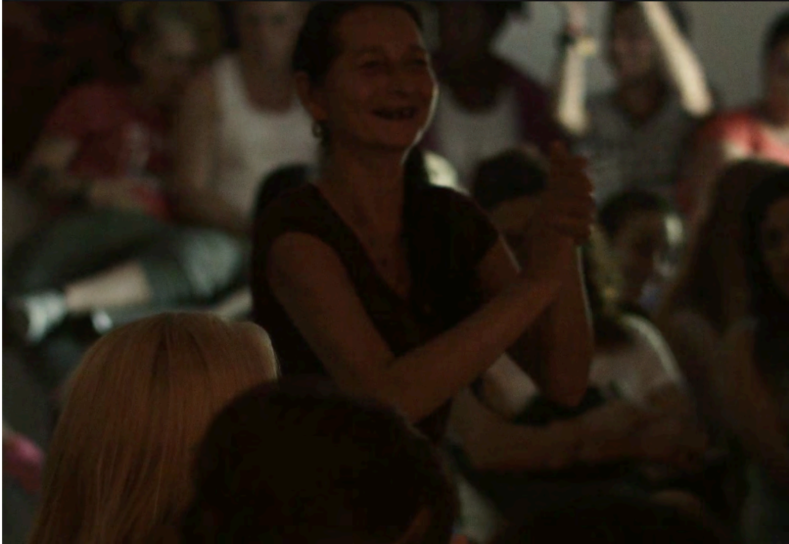
Centre Penitenciari de Dones de Barcelona