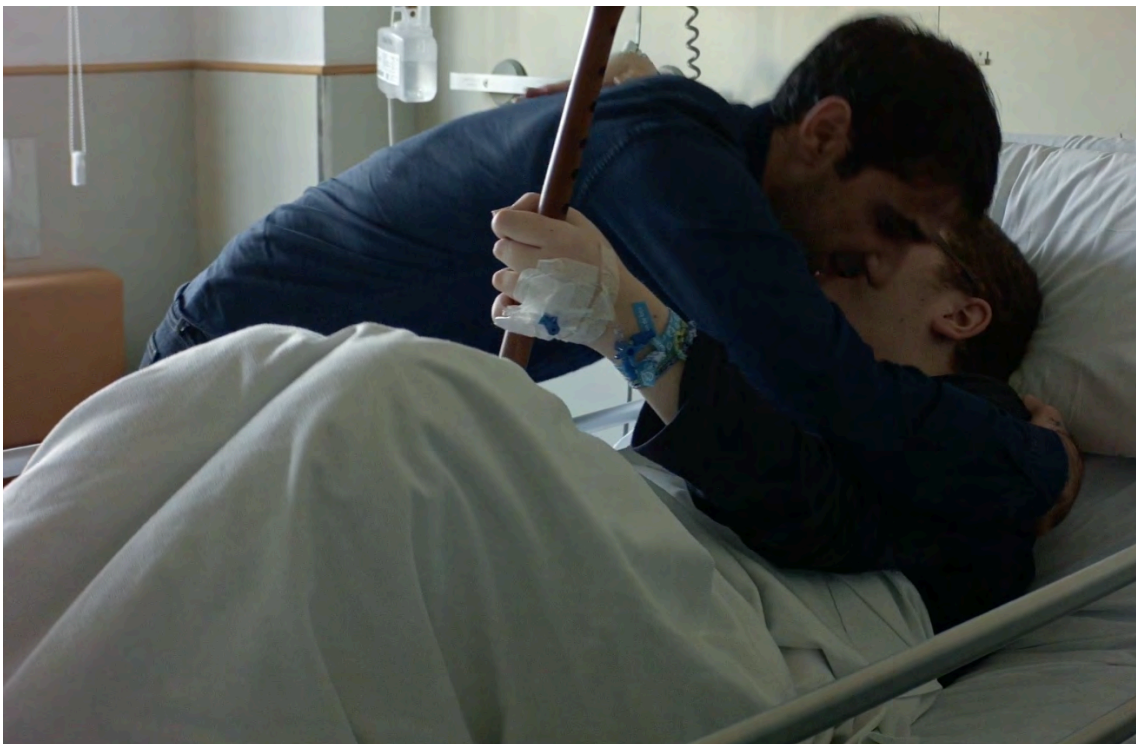
Hospital Sant Joan de Déu